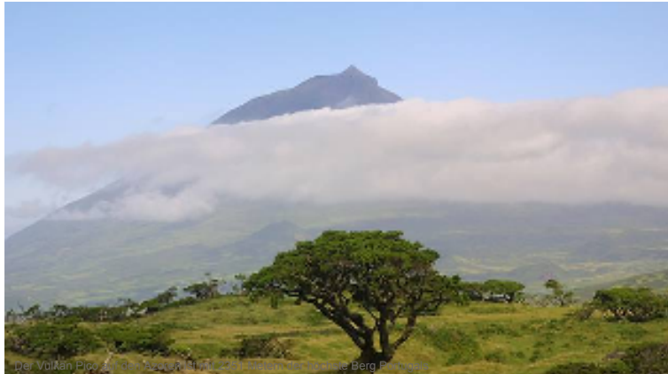
Der Vulkan Pico da Formosa auf der Insel São Jorge.